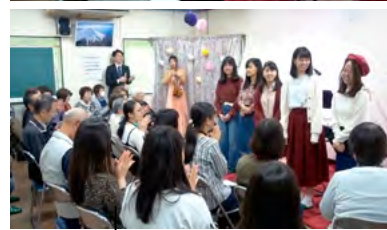
④演奏に合わせて歌う参加者のみなさんと、⑤拍手に包まれるアカペラグループ「りんご屋さん」

⑥浦賀団地に暮らす団地活性サポーター（県立保健福祉大学生）、⑦りんご屋さんのメンバー、⑧浦賀団地のご入居者・団地活性サポーター・演者による記念撮影