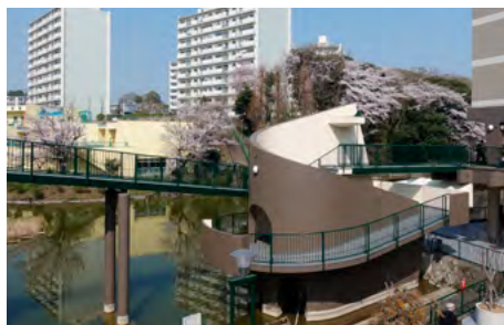
▼竹山池と並ぶもう一つのシンボルの螺旋階段