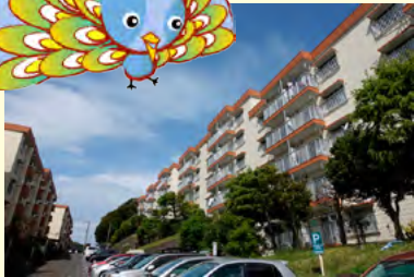
▲コンサート当日の浦賀団地

平成30年4月7日、浦賀団地（横須賀市浦上台）にて3回目となる団地コンサートが行われました。今回は、団地活性サポーター制度で連携している神奈川県立保健福祉大学のアカペラサークルに所属するグループ「りんご屋さん」が出演し、その美しいコーラスで会場を大いに盛り上げました。