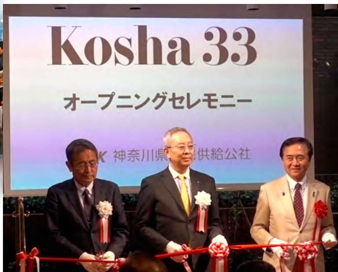
▲ Kosha33 スタジオで行われたオープニングセレモニーでのテープカット。右から黒岩神奈川県知事、当会社・猪股理事長、シニアライフ振興財団・安室理事長

当社は、公的役割のひとつとして、「人を、まちを、住まいをつなぐ 33 番地」をキーワードとした「Kosha33 (コウシャ サンジュウサン)」のオープニングセレモニーを、平成 30 年 3 月 20 日に行いました。この Kosha33 には「スタジオ」、「カフェ」、「ライフデザインラボ」、「イベントホール」のゾーンがあり、住宅や暮らしについての情報発信を行っていきます。