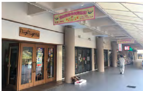
▲生まれ変わった竹山団地中央商店街