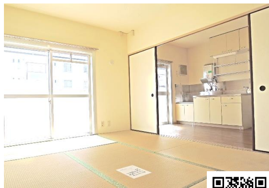
その他の写真はQRから

サポーター活動やそのご報告を行っていただくことで、毎月の家賃が半額に！礼金、仲介手数料、更新料もかかりません。