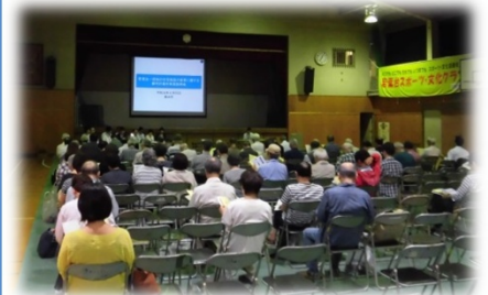
↑ 横浜市による都市計画変更 素案説明会・公聴会開催 ・身近な土地利用課題の検討