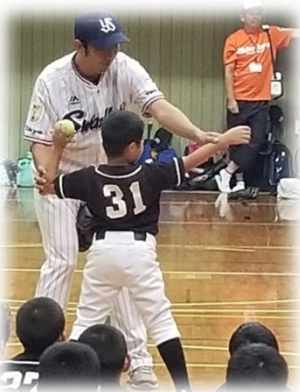
↑ 地域団体と近隣大学の連携 による「健康フェスタ」開催