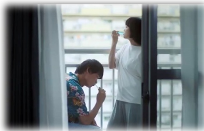
↑ 映画「ドンテナウン」ロケ撮影 ・各種取材・情報発信・視察 ・オンデマンドバス実証実験 ・「たからものマップ」完成