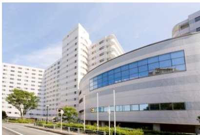
設立第 1 号のヴィンテージ・ヴィラ横浜（外観）

公社は平成 2 年に、公的住宅機関として全国初となるケア付高齢者住宅「ヴィンテージ・ヴィラ」を開設し、今年で 28 年目を迎えようとしています。神奈川県内に 5 施設（横浜、向ヶ丘遊園、洋光台、相模原、横須賀）818 戸を展開しており、入居率も 95% 以上を維持し大変高いご支持をいただいております。「ヴィンテージ・ヴィラ」の特徴は元気なうちにご入居いただく「入居時自立」。公社独自のプログラムで、自立した生活を限りなく延長していただくことを目的としています。