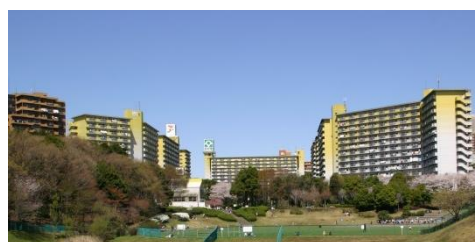
広大な敷地の若葉台団地