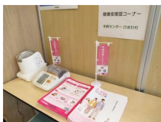
未病センターのコーナー