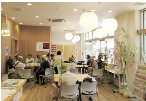
若葉台団地住民の憩いの場「ひまわり」

（※1：未病センター：県では県民が食・運動・社会参加を通じて、より健康な状態となることを目指す「未病改善」の取組みを推進しており、健康状態を気軽にチェックや相談できる場所を認証する制度。県内 32 箇所）