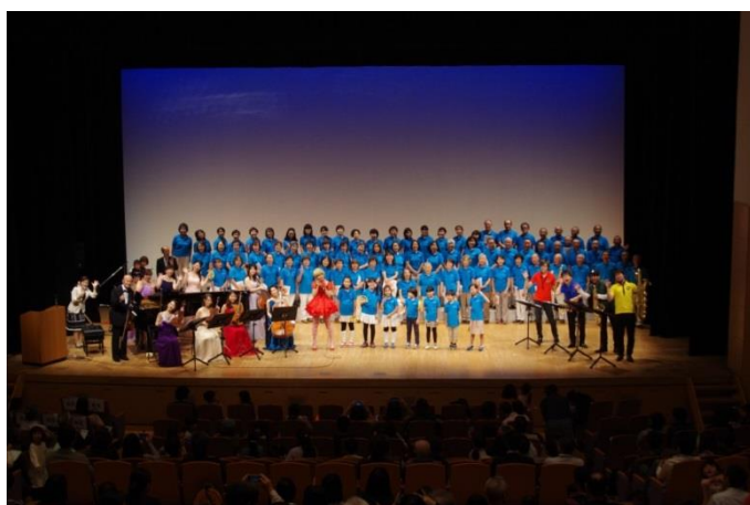
【昨年の音楽祭の様子 2017 年 10 月】