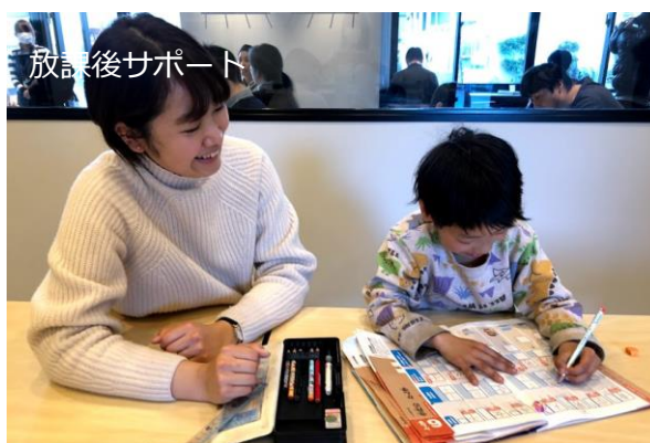
小学生向けに放課後の時間で宿題の見守り

営業時間：10:00～20:00（ラストオーダー19:30） 定休日：日・月・祝