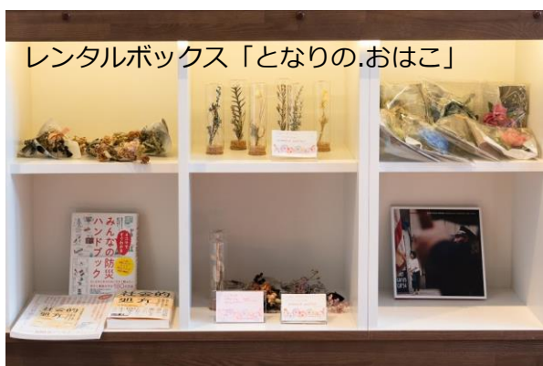
箱型ボックスで雑貨の委託販売

営業時間：10:00～20:00（ラストオーダー19:30） 定休日：日・月・祝