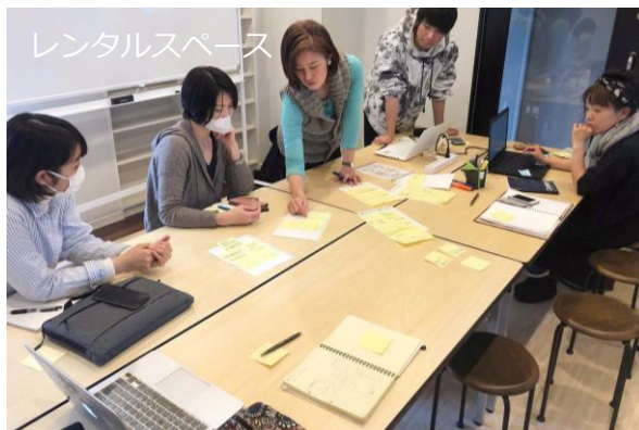
講座や習い事の会場に使える貸切個室