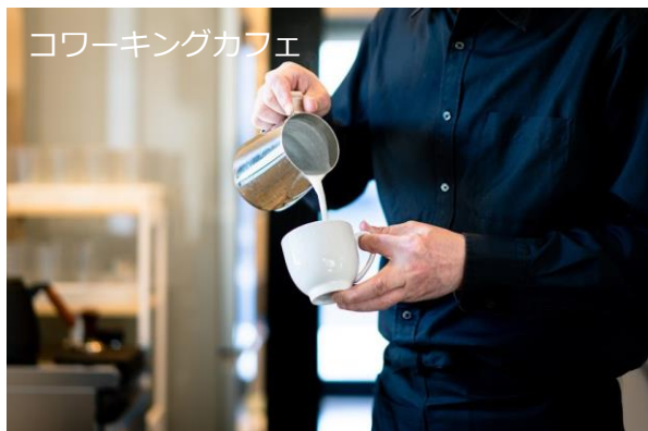
バリスタが淹れるコーヒーや週替わりサンド