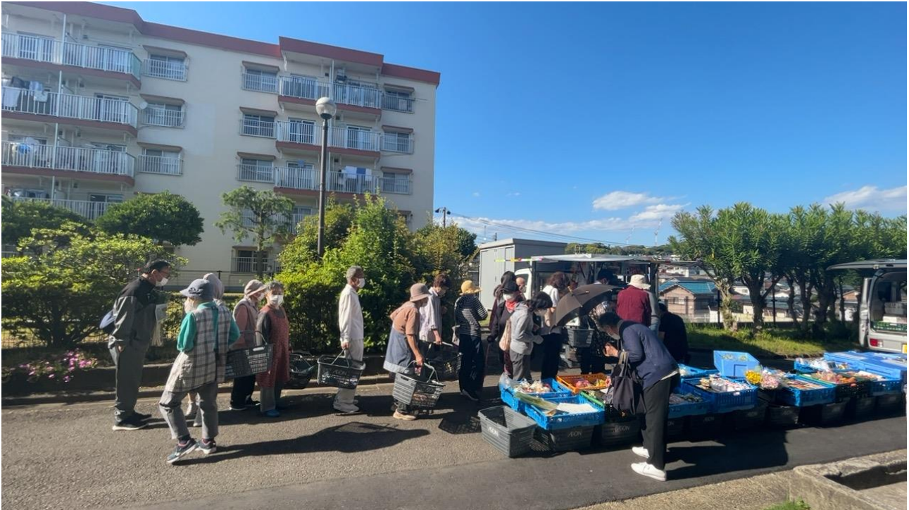
2023年5月より移動販売がはじまった浦賀団地（横須賀市）

神奈川県住宅供給公社(所在地：横浜市中区)は、2023年4月に当公社の団地での移動販売事業（キッチンカー含む）を展開できるルールを整備しました。（ニュースリリース「公社の団地で移動販売の受入れを本格的に開始します」[2023-04-11] https://www.kanagawa-jk.or.jp/news/?id=1432 ）