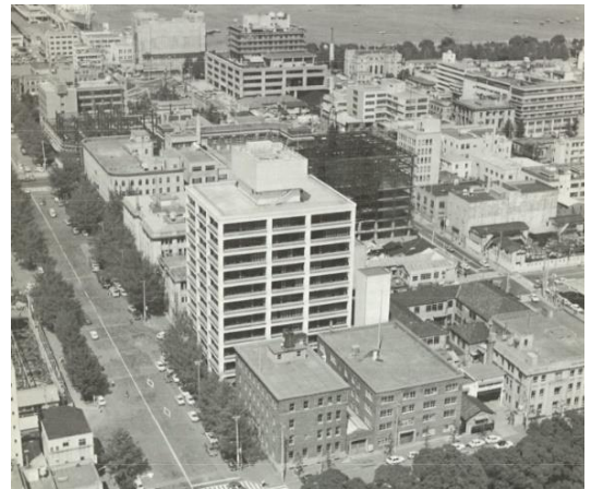
▲「住みよい暮らしを創る」 神奈川県住宅供給公社25周年記念誌（1975年9月）より

1973年に竣工した神奈川県住宅供給公社(所在地：横浜市中区、以下公社)の本社ビルは、建設から50年以上が経過。建物の構造上は問題ないものの設備関係の老朽化・陳腐化が進行していたことから、2023年2月に大規模改修工事に着手し、2024年8月に完成しました。「ライフサイクルコストの低減」、「快適な執務空間」、「自然災害発生時の事業継続」などに重点を置き、真空ガラスによる断熱効率のアップや個別空調等の設備、執務室等の内装、外壁塗装など大規模なリニューアルを実施しました。そして10月に本社ビルへの戻り移転が終了。2018年に整備した公社ビル1・2階の情報発信拠点「Kosha33」は、日本大通りエリアの活性化など3つのコンセプトを定め、これを実現するために、新たなパートナーを迎え12月に運営を再開する予定です。