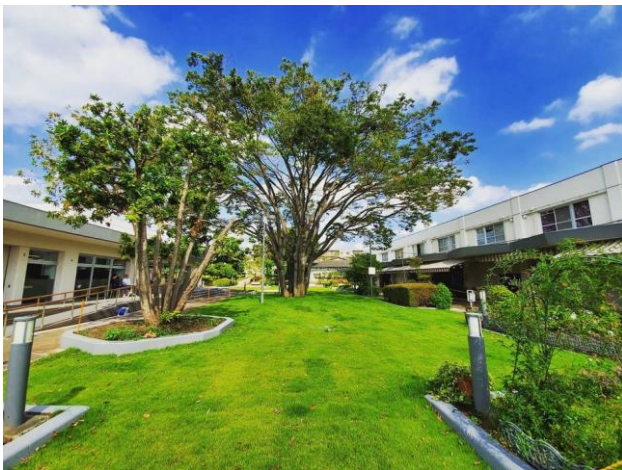
商店街前広場の様子

なお、今回からはより様々な方にお申込みいただけるよう、空店舗が出た際に随時申し込みを受けられる「随時募集」の形式で募集を開始いたします。