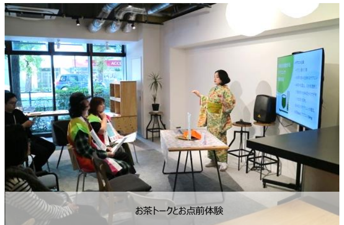
お茶トークとお点前体験