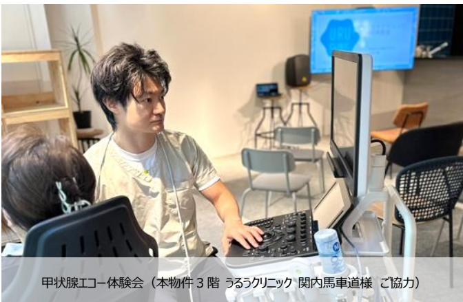
甲状腺エコー体験会（本物件 3 階 うるうクリニック 関内馬車道様 ご協力）

ハイカラフェスタと同日開催。クイズラリー、ミニライブ、ミートーク会、甲状腺エコー体験会